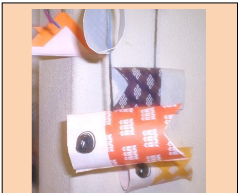
家の中でもそよ風を感じますね♪