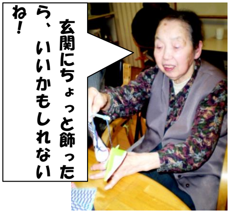
玄関にちゃっと飾ったわ！ う、いいかもしれないね！