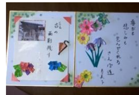
喜びも悲しみも 包んでくれる さんぽ道 Y.S