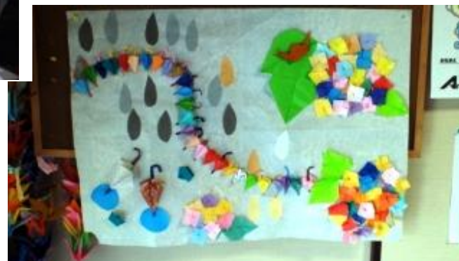
さんぽ道 6月のクラフト作品です。

↑展示会で1年間の集大成を展示! さまざまな力作が並びました。 来場された方々より感嘆の声が あがりました。