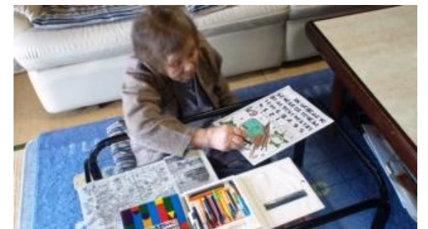
今月のカレンダーを塗ってるのよ。