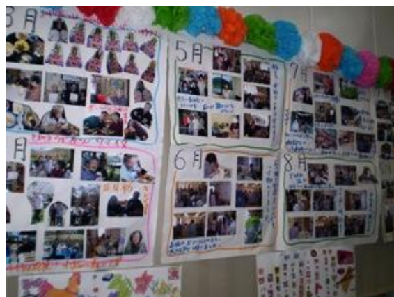
両宮の里展示会での写真展示