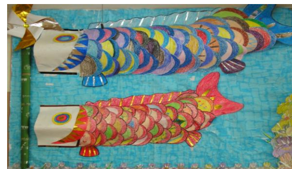
亀池こいのぼりです。