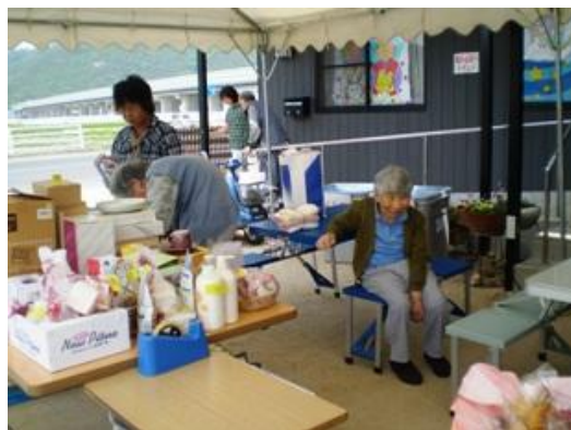
バザーも大盛況でした。