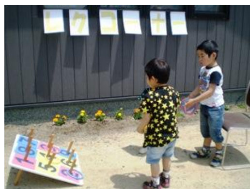
輪投げコーナーで。