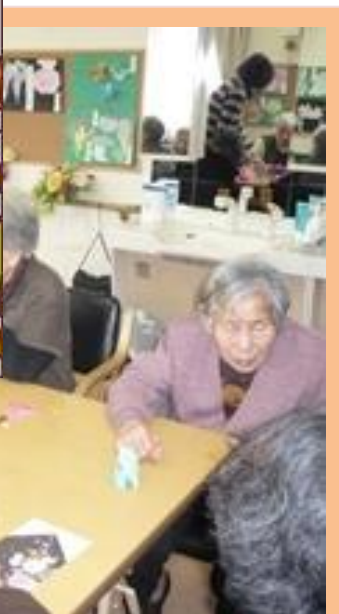
“やま折り” “たに折り” 上手にできました!