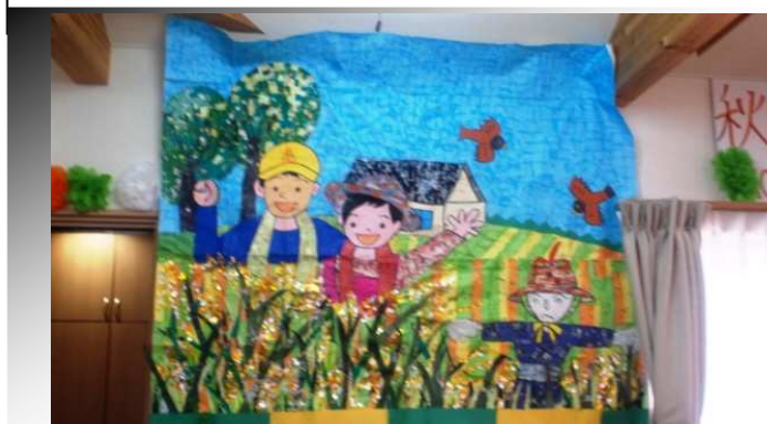
亀池荘の実りの秋がやって来ました！

さんぼ道では、この時期ならではの菊花壁紙を製作しました。立派に出来上がった作品に、「いいのが出来た！」と喜んでおられます。