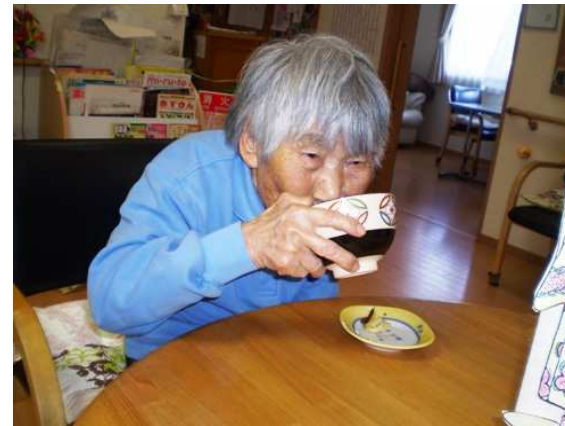
結構なお点前で… おまんじゅうも美味しかった…