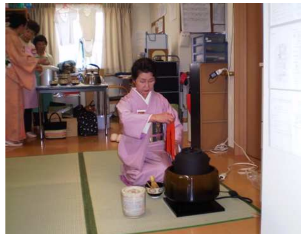
日本の伝統文化に触れました。 皆様本当に喜ばれていました。