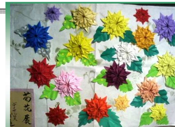
さんぼ道の菊花展です。 後楽園には負けません。