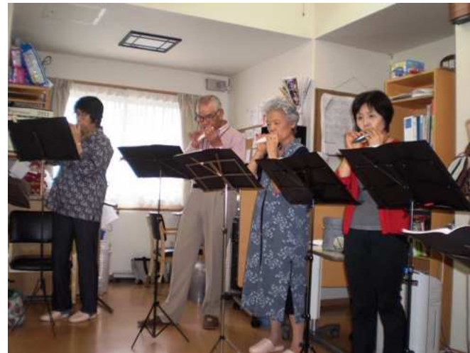
オカリナの調べをみんなで堪能しました。 とても優しい音色でした。