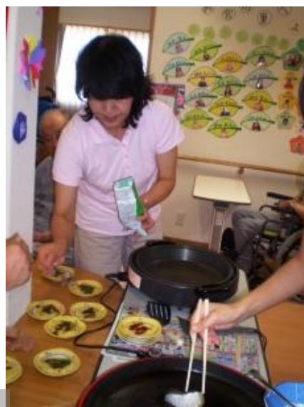
さあ、皆でお好み焼きを つくみましょう！