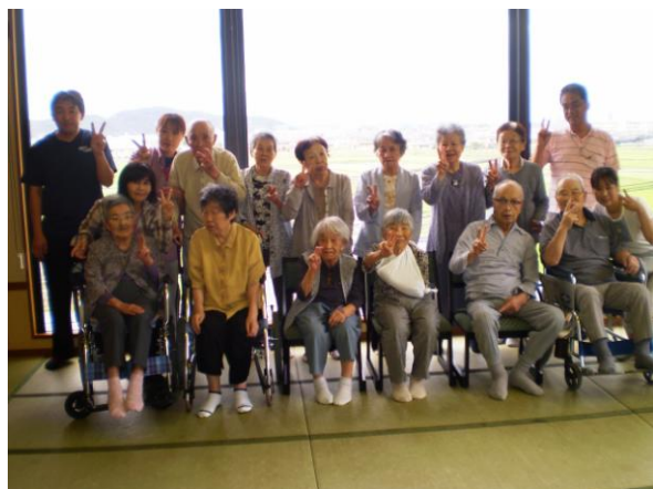
湯迫温泉 白雲閣へ！ みんなそろってピース！