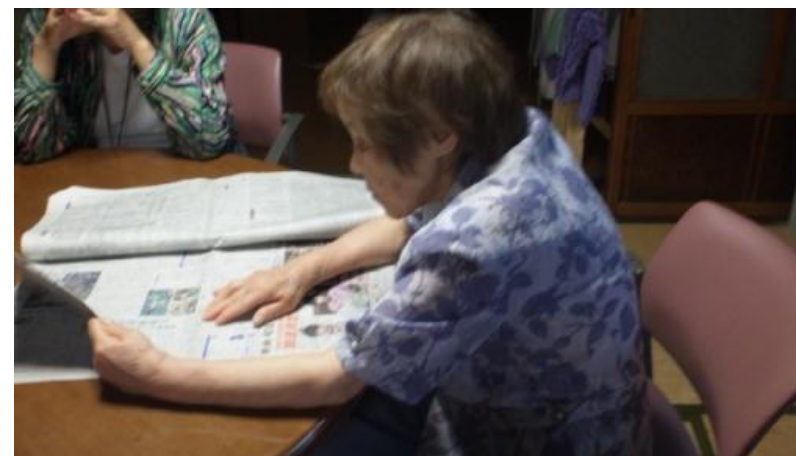
読書の秋です。さあ、新聞でも読もうかな。