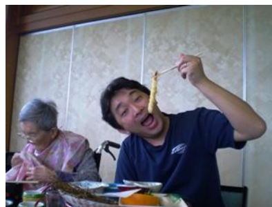
大きな海老のてんぷら！ いただきます。