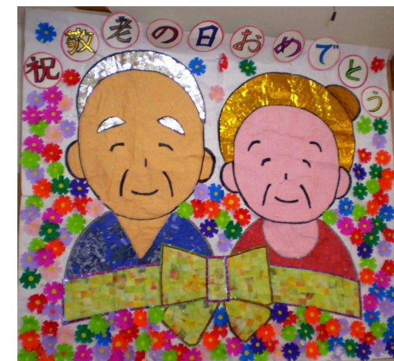
亀池荘の素適な張り絵が出来ました。