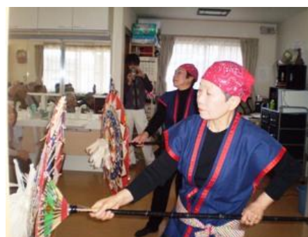
銭太鼓のボランティアの方が来て くださいました。感謝。