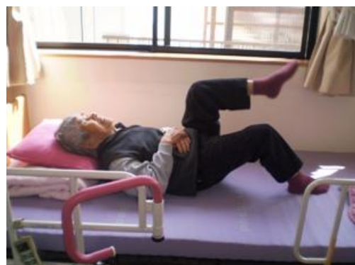
よいしょっと。筋肉トレーニング!