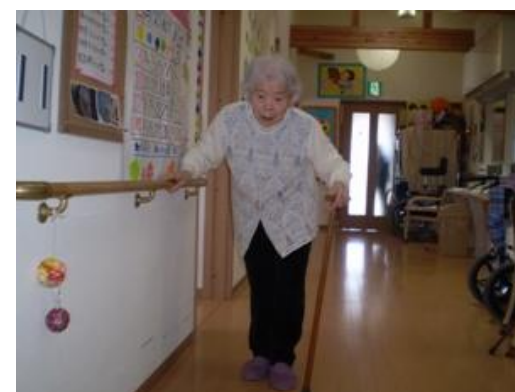
いつもコツコツと努力されています。