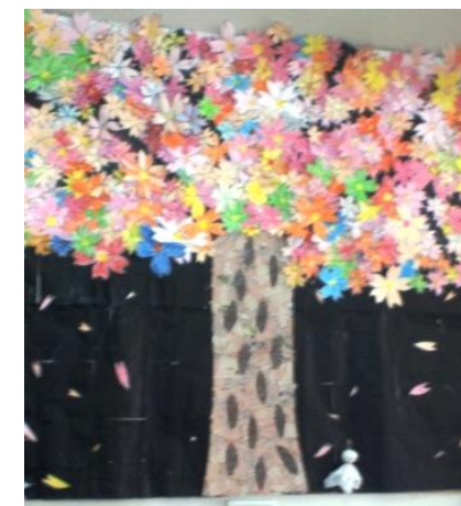
亀池荘の一本桜です。