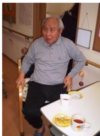
美味しいおやつじゃなあ