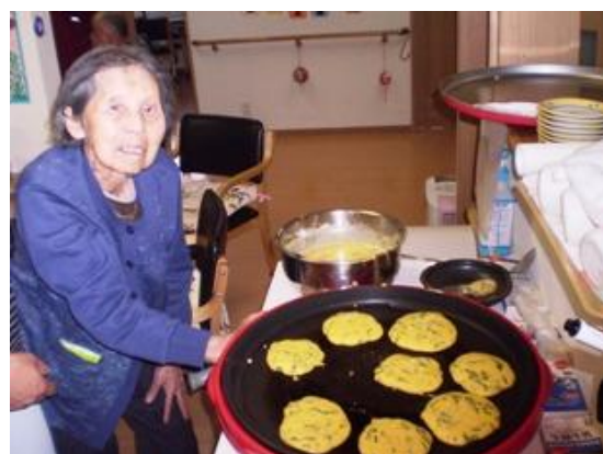
鉄板焼きよ!美味しくできたわあ!