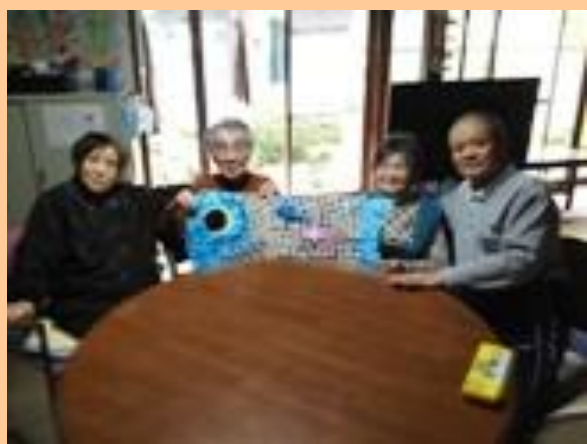
みんな仲良しさんぽ道