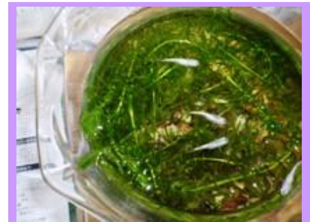
創和の心の癒し。 めだか達です。いつもありがとう。