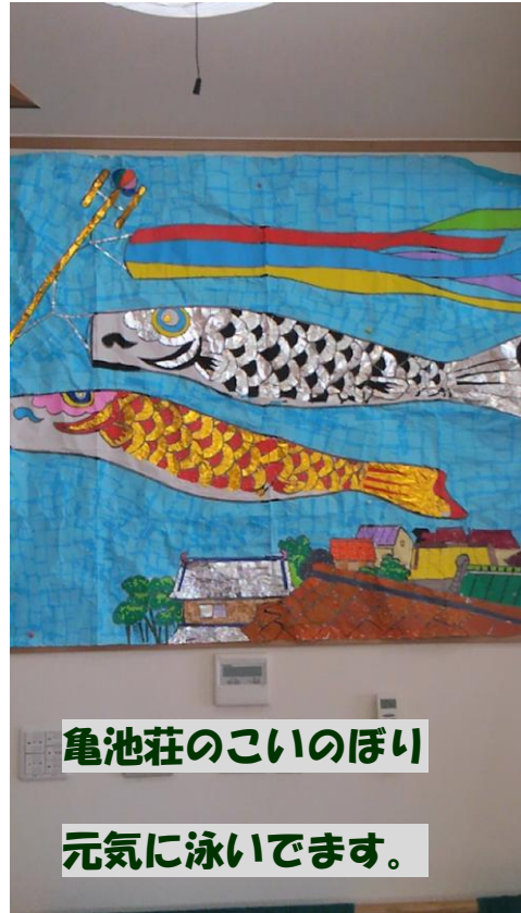
亀池荘のこいのぼり