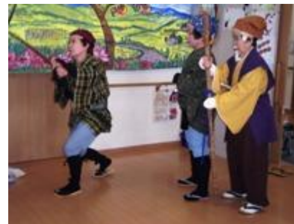
黄門様がきました①