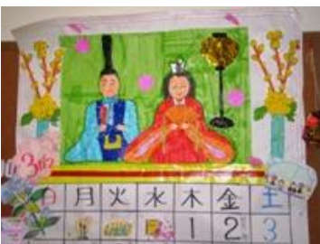
両宮の里に 春がきました。