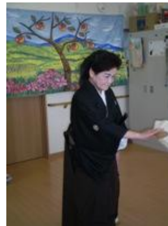
かっこいいですね。