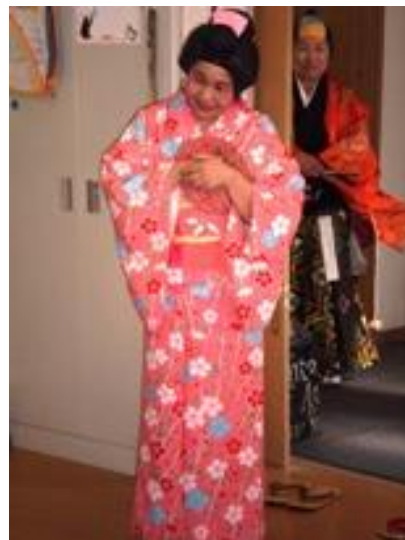
町娘・・・えっ まさかスタッフの〇〇さん