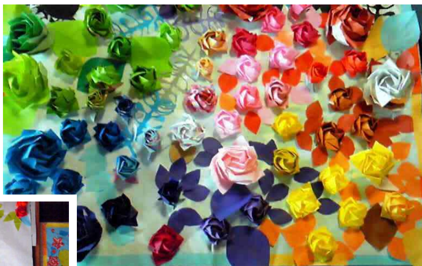
さんぽ道みんなの