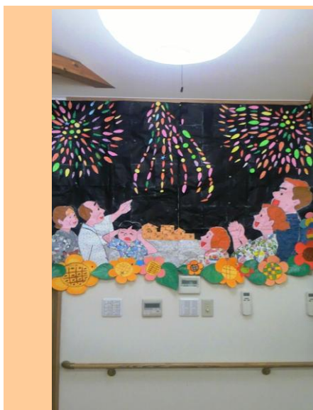
亀池荘の花火です。