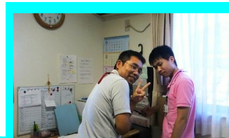
とても仲良しです。