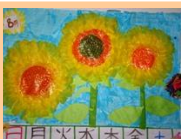
両宮の里にひまわりが咲きました。