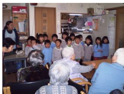
子供たちの天使の歌声を聞きました。