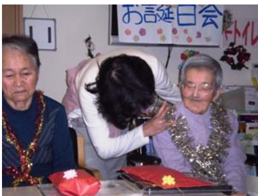
お誕生日会ですね。 よかったね。