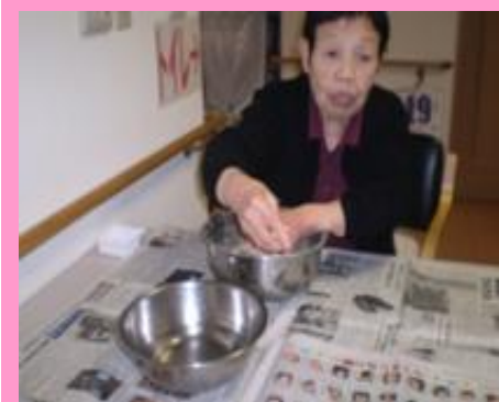
なにができるかな?