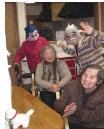
ボランティアの方と・・・おや? 顔なじみの人達も混ぜて踊っている!?