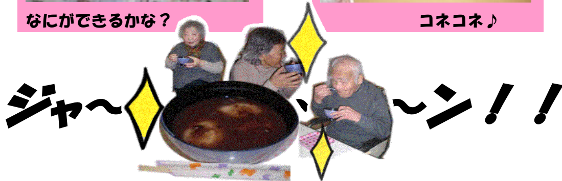
大変美味なおしるこで、ござった!!