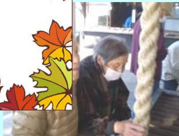
初詣に足王神社へ参拝!