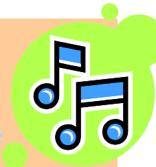
大正琴の音色にうっとり