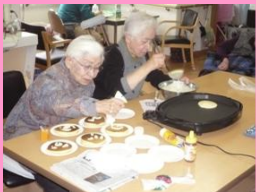
私たちはトッピング担当よ♪