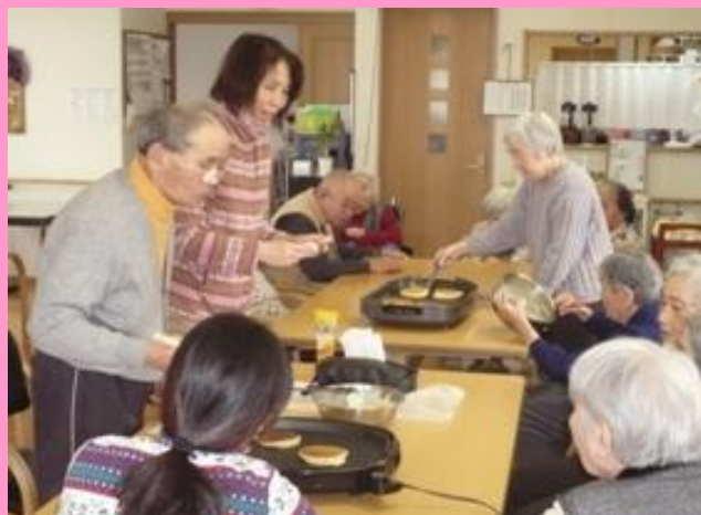
♪ホットケーキ作り