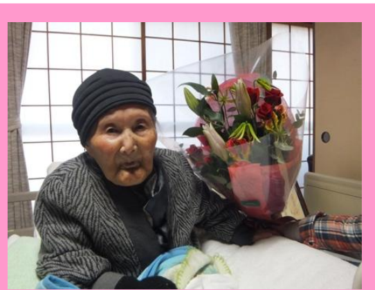
100歳おめでとうございます♪